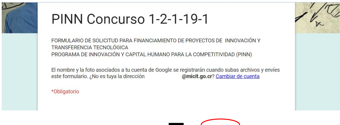
Imagen #4: Aspecto del formulario y cambio de cuenta de Google